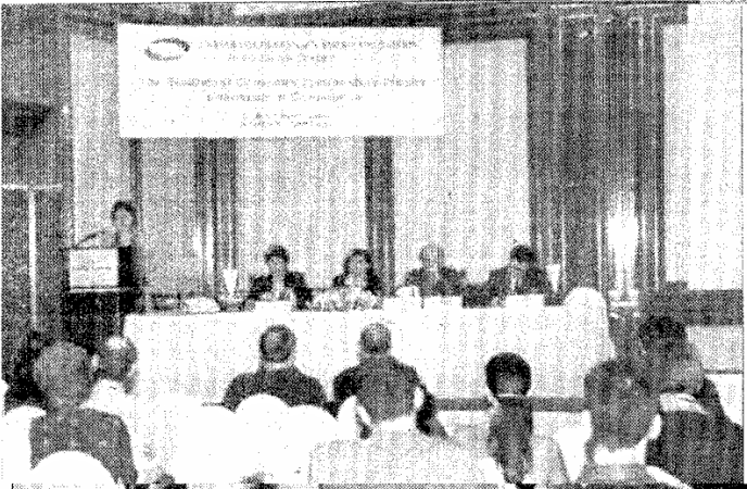
На последната конференција во Атина историчарите заклучија дека мора да се менува односот кон историјата во учебниците

Ако се суди според учебниците по историја на балканските простори, не се поставува прашањето дали на Балканот ќе има нова војна, туку само кога повторно ќе дојде до неа - заклучуваат историчарите